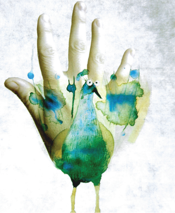
Case extraite de la BD: Main-ce alors! de Clémentine Hauguenois, Université Laval

Quatre mentions spéciales seront décernées par le jury et accompagnées d'un prix de 100 $ chacune.